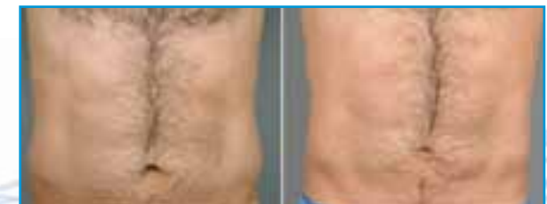
Antes del Tratamiento