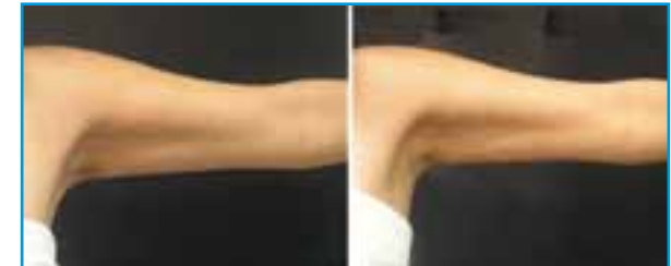
Antes del Tratamiento

Este tratamiento también está indicado para la disminución de la apariencia de la celulitis, principalmente porque este problema está ligado a la flacidez. Así, al dar firmeza a la piel, la apariencia de la celulitis disminuye.