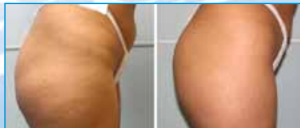
Antes del Tratamiento

En este lapso se podrán realizar de una a varias sesiones dependiendo de la piel, su condición y de la respuesta individual de cada paciente al tratamiento.