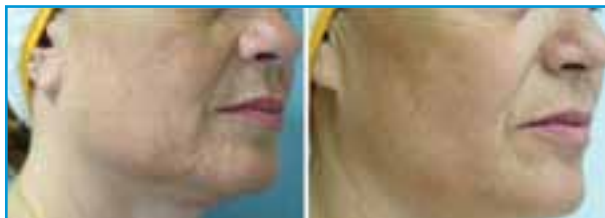
Antes del Tratamiento

Útil en cara y cuello para lograr la contracción de la piel (efecto lifting) ya que redefine el ovalo del rostro, levanta los pómulos y las cejas, así como el cuello (papada) y remodela el contorno de los ojos.